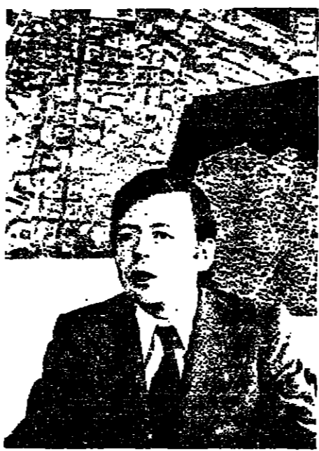
A Lebanese family probing the wreckage of the capital. French urban planner Ligne: 'We don't want Beirut to lose its soul'